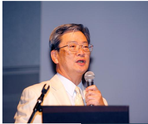
平方先生のご講演