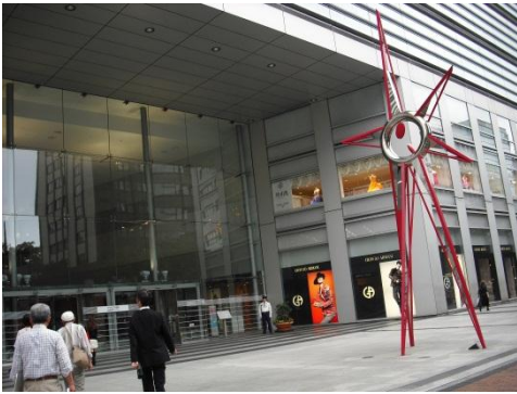
アクロス福岡（会場）外観