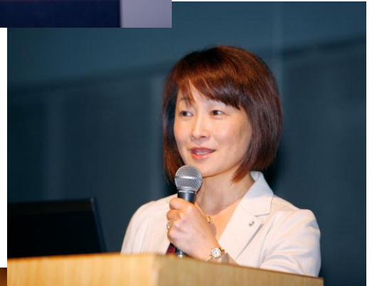
水内先生のご講演