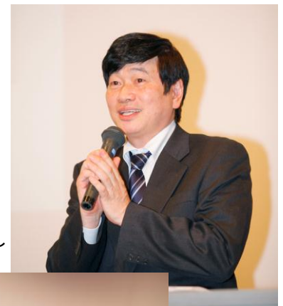
脇坂先生のお話し