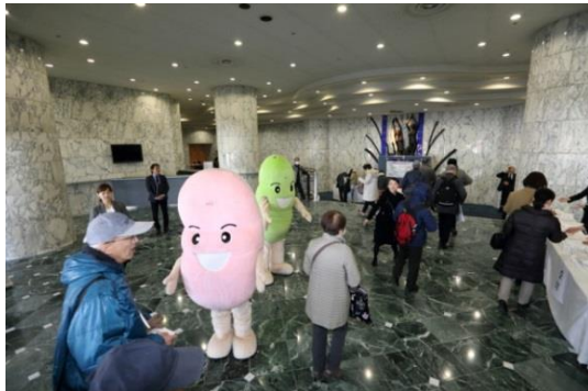
【腎臓キャラクター「そらめくん」と受付の様子】