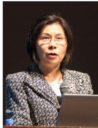
【市川先生のご講演】